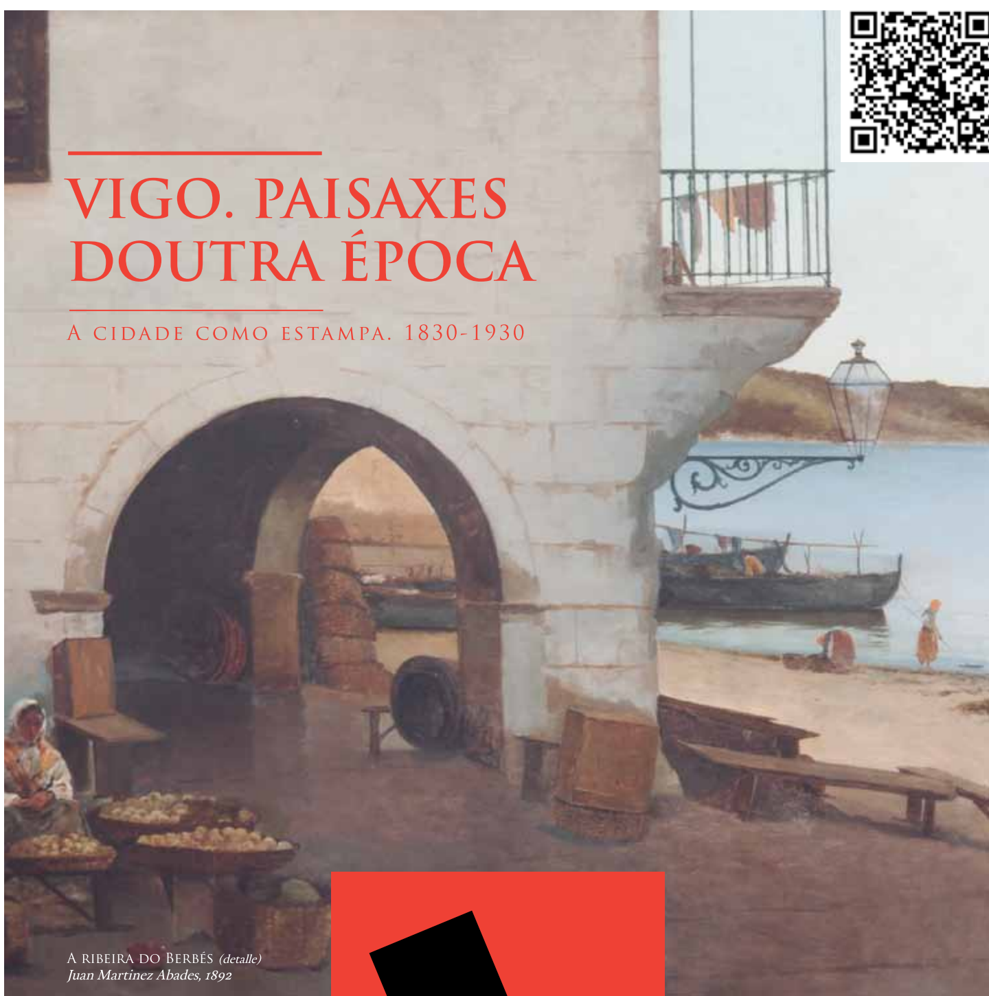
A RIBEIRA DO BERBÉS ( detalle ) Juan Martínez Abades, 1892

Do 16 de xullo ao 27 de setembro do 2015