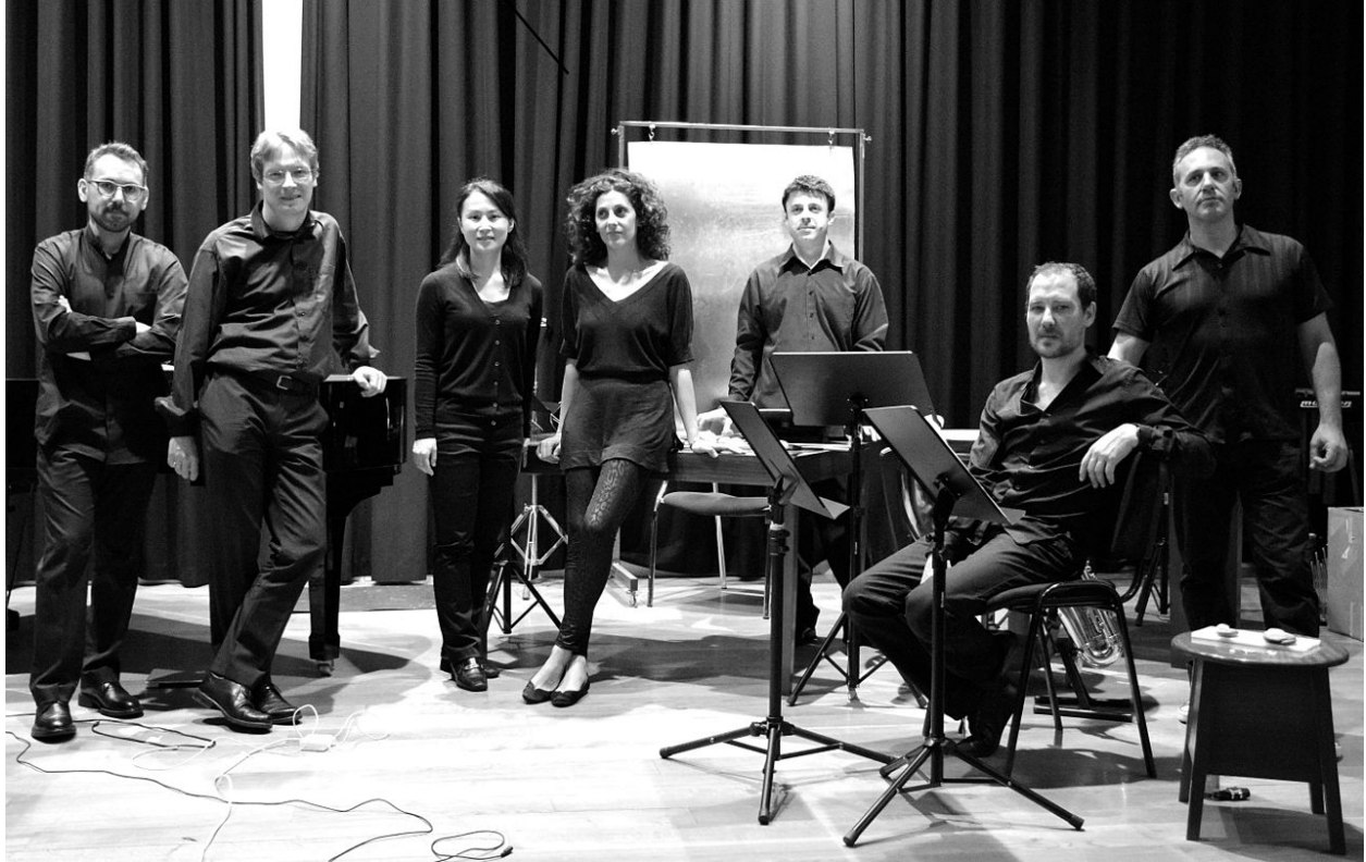
VERTIXE SONORA ENSEMBLE