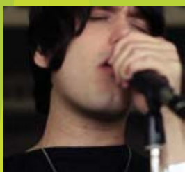
“IRA” The Blows Iñaki Gil Rosendo | 2012 | 5 min