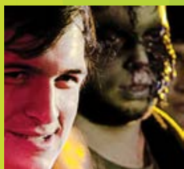
“MILES OF HOPES” When Ocean Burns Fer Pereiro | EISV | 2013 | 4 min