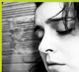
“BANSHEE” The Gone & Lost Francisco Gallego Guisán | Axitopop | 2013 | 5 min