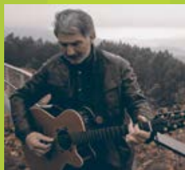
“NINGUÉN ESCOITOU” Urbano Cabrera Pablo Aragüés | Marta Cabrera | 2013 | 5 min