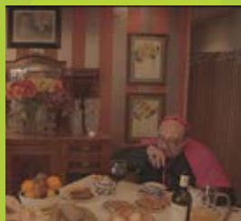
“WILDA” Cró! José Araújo Pérez | 2014 | 4 min