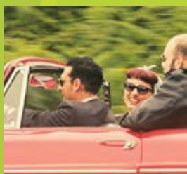
“LA PRIMERA VEZ” Inculpados José Luis González | JLG. Barceló | 2012 | 5 min