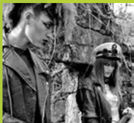
“LEAVING ALONE” Thee Blind Crows Gero Costas | Producciones Mutantes | 2014 | 6 min