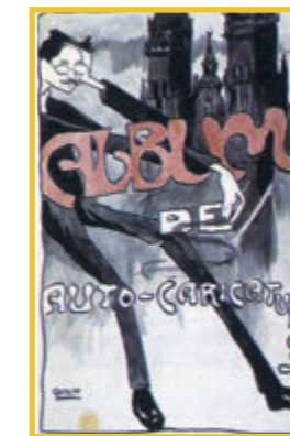
Album de autocaricaturas de Castelao (Doazón de Francisco Fernández del Riego)

O patrimonio da Biblioteca Penzol constitúe un conxunto amplísimo de publicacións referentes a Galicia, de autoría galega ou editadas na nosa terra. Neste campo, é unha das máis importantes bibliotecas do noso país, tanto polo volume como pola calidade do seu patrimonio, que inclúe numerosos libros e impresos raros, varios únicos e algúns incunables, ademais de valiosos fondos arquivísticos e especiais.