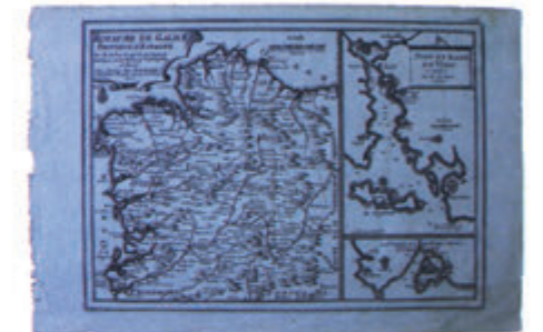
Royaume de Galice. Mapa de Galicia por N. De Fer. París, 1705

A Fundación asume como finalidades primordiais velar pola conservación, organización e difusión do dito patrimonio e manter a biblioteca como un servizo básico á cultura galega. Os fondos da Biblioteca Penzol son de tres clases: