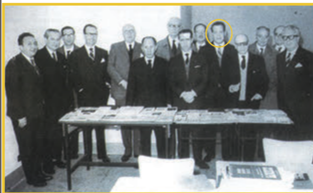
Penzol co equipo da Editorial Galaxia e as súas primeiras publicacións

Outra das liñas mestras da súa singradura vital foi a paixón polos escritos e documentos sobre Galicia. Logo de axuntar unha das bibliotecas persoais máis valiosas do noso país, e consciente das dificultades que afrontaban os estudosos das cousas galegas, decidiu doala para uso público. En 1956 entregou ese tesouro en depósito á Editorial Galaxia para a constitución dunha fundación.