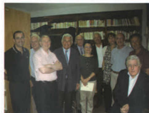
Membros do Padroado da Fundación despois dunha xuntanza. 2010

Grazas a un convenio asinado co Concello de Vigo en 1985, a Fundación e Biblioteca Penzol pasaron a ocupar as súas actuais instalacións, e puideron contar cun corpo de persoal técnico. O Concello de Vigo tamén asume os gastos de funcionamento e equipamento da Biblioteca. A nova sede foi ampliada e remodelada en 1995, cando o edificio da Casa Galega da Cultura que a alberga pasou a acoller tamén o Museo e Biblioteca Fernández del Riego. Nos últimos anos, con novos estatutos e un padroado renovado, a Fundación está a gañar novo pulo.