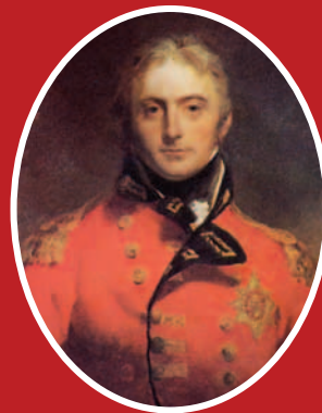
Sir John Moore

O 1 de xaneiro de 1809 entran os franceses en Galicia, con dous exércitos ao mando dos mariscais Soult e Ney. Veñen perseguindo ao exército británico do xeneral John Moore, que evacúa á súas tropas en A Coruña de volta a Inglaterra. Mentres os soldados comezan o embarque, líbrase a batalla de Elviña, na que morre Moore, aínda que consegue salvar á meirande parte dos seus homes. Tras esta victoria, as forzas napoleónicas dedícanse á ocupación de todo o territorio galego.