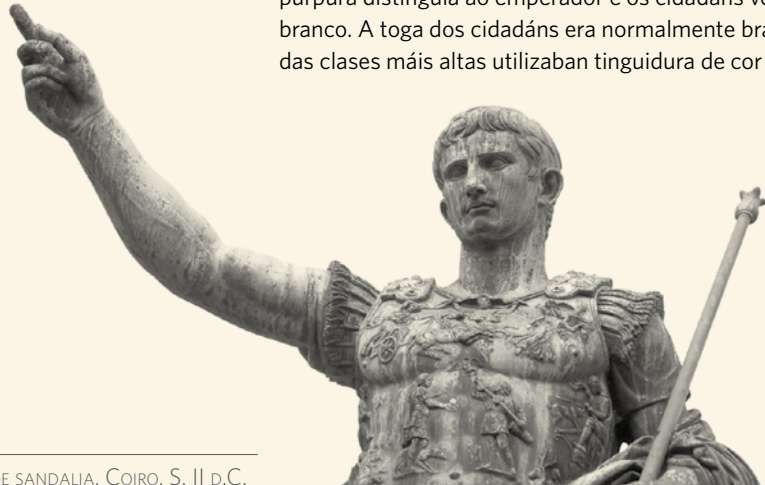
SOLA DE SANDALIA. COIRO. S. II D.C.

Un manto, a toga, era a prenda principal e só podían utilizala os cidadáns para diferenciarse dos escravos. A de cor púrpura distinguía ao emperador e os cidadáns vestían de branco. A toga dos cidadáns era normalmente branca e na das clases máis altas utilizaban tinguidura de cor púrpura.