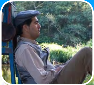
MAGO TETO (GALICIA)

I Festival de Maxia de Rúa DO 6 AO 9 DE ABRIL DE 2023