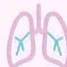
SENSACIÓN DE FALTA DE AIRE

Asegurarse de que a información sobre o COVID-19 procede de fontes fiables, como axencias nacionais de saúde pública, profesionais médicos ou a OMS. Como o Ministerio de sanidade o Centro europeo para a prevención e o control de enfermidades (ECDC) ou Organización mundial da saúde